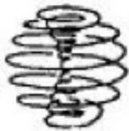
Рис. Сферический вихрь.

Чтобы не гадать и не строить собственных представлений о форме тела, обратим свой взор в Космос. Что мы там видим – все круглое и ... спиралевидное! Оказывается, для того чтобы появилась форма, объем – должно возникнуть движение. И движение не простое, а спиралевидное и вихревое – когда спираль замыкается на саму себя и образует устойчивую, объемную фигуру.